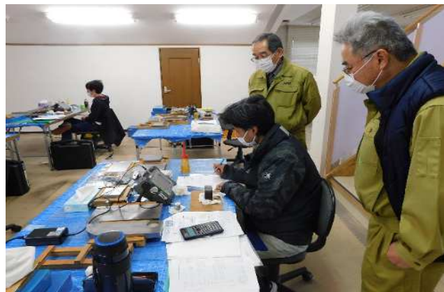
超音波探傷試験レベル1講習状況

なお、弊社には超音波探傷試験以外に磁粉探傷試験及び浸透探傷試験について、試験会場にあるものと同じ試験器材が揃っています。