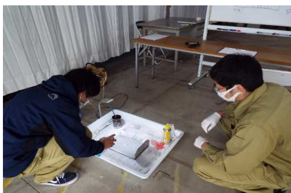
溶剤除去性浸透探傷検査