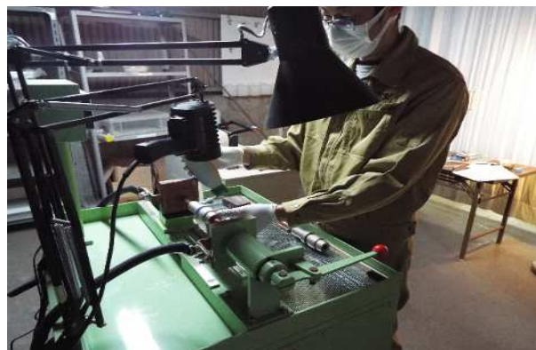
磁粉探傷装置による各種探傷