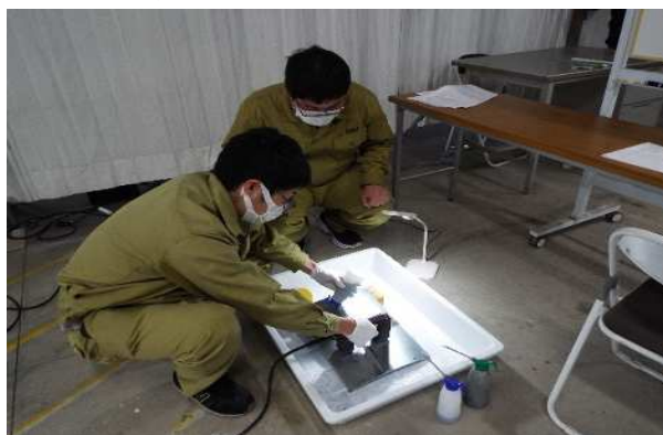
極間法磁気探傷検査